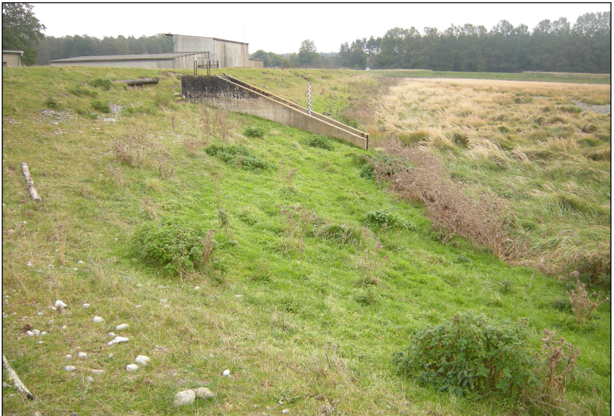
Abbildung 3: östliche Plangebietsgrenze mit baulicher Vorprägung