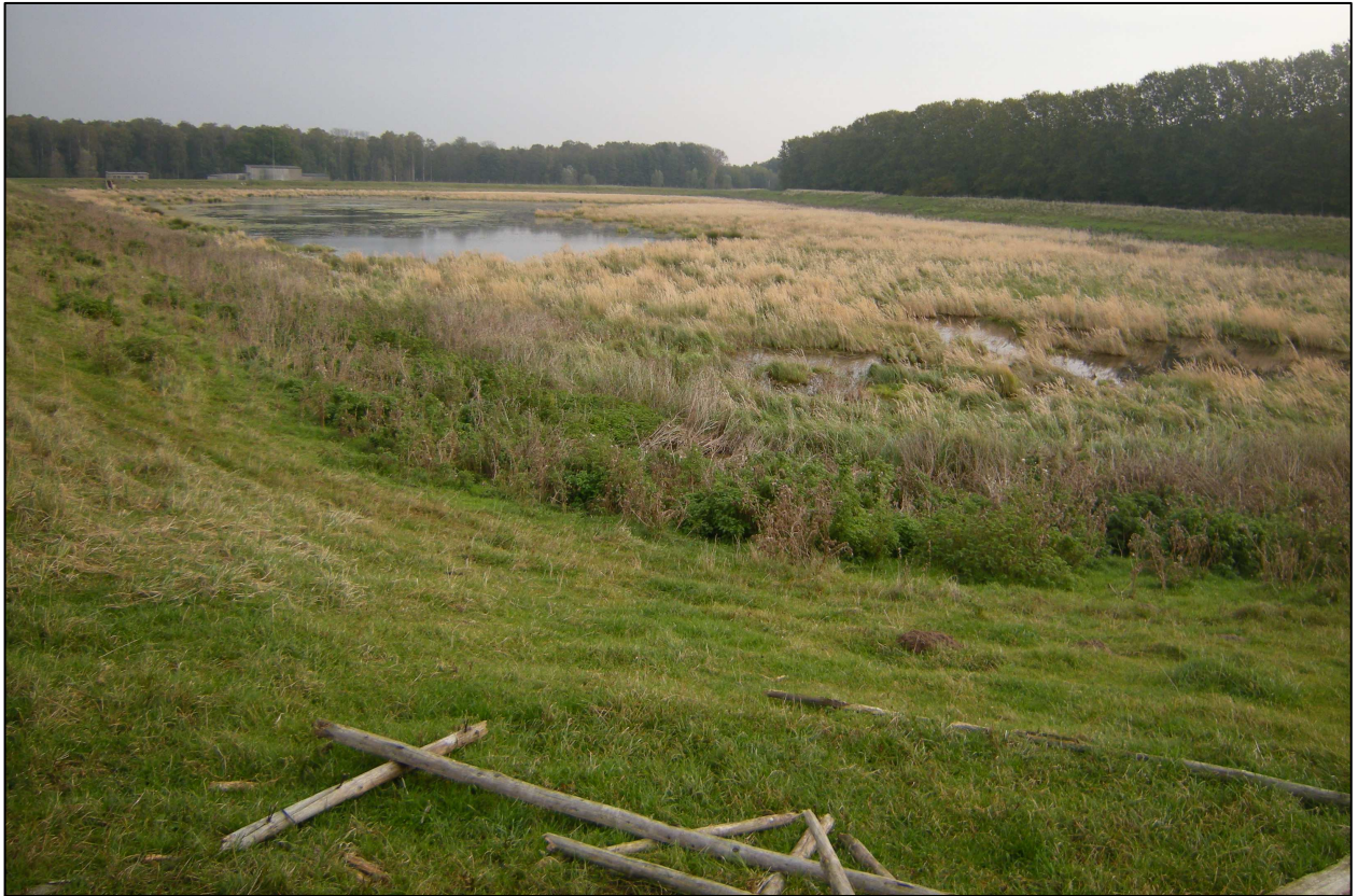
Abbildung 2: südliches Becken mit Blickrichtung Osten