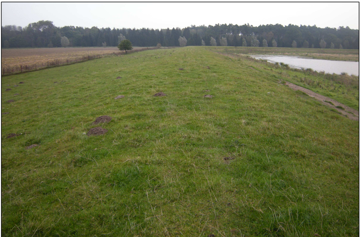
Abbildung 1: nördliches Plangebiet mit Blickrichtung Osten

Die Konversionsfläche ist durch eine hohe organogene Belastung des anstehenden Bodens gekennzeichnet. Das Gelände ist eingezäunt und umfasst zwei Becken. Umlaufend bestehen flach auslaufende Erdwälle aus dem Aushub der Becken.