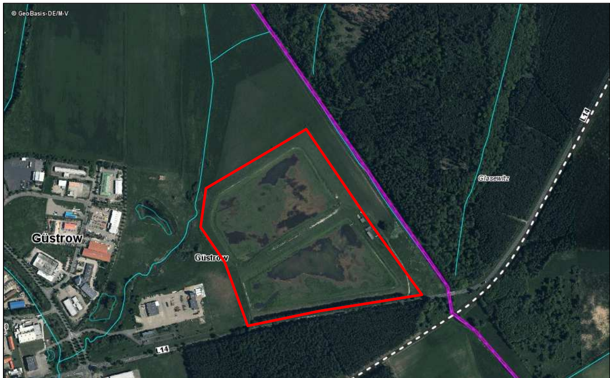
Abbildung 4: Luftbild des Planungsraumes mit Darstellung des Geltungsbereiches (rot markiert)

Die Beckenböden sind abschnittsweise mit Gras und Hochstauden bewachsen. Teilflächen sind durch einen niederschlagsintensiven Sommer mit Wasser überstaut.